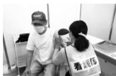
▲コロナワクチン接種の促進