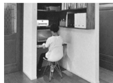
テレワークスペースに改修▶