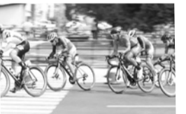
自転車ロードレース大会の開催▶