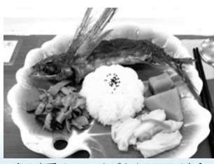
▲島の定番メニュー トビウオのフライ定食