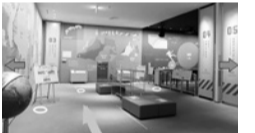
▲デジタル地震防災センターの完成イメージ