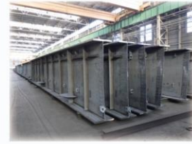
▲和歌山県の製作工場の外観と橋げた製作の様子