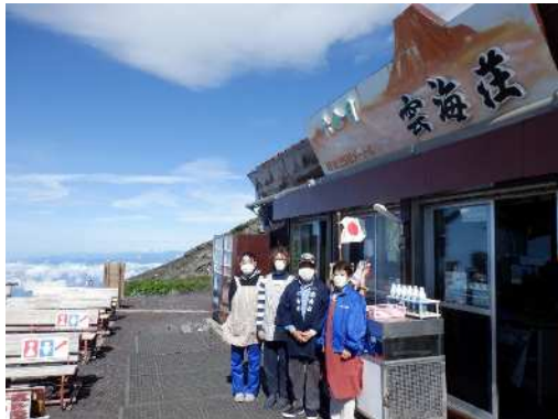
六合目 雲海荘の皆さん