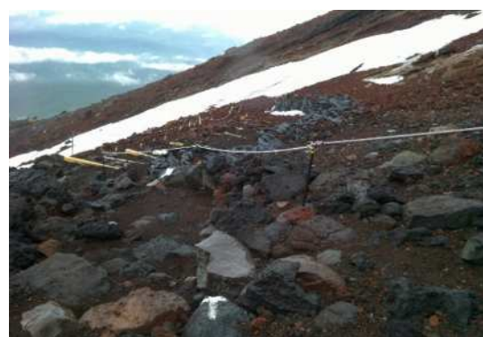
九合五勺付近（7/6撮影）