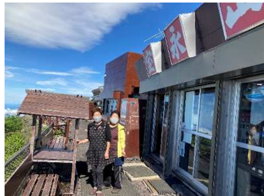
六合目 宝永山荘の皆さん