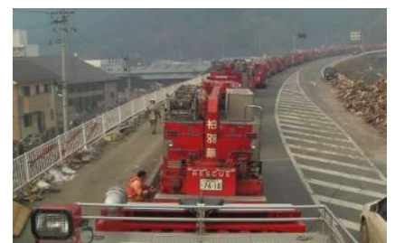
緊急輸送路の状況 (東日本大震災)