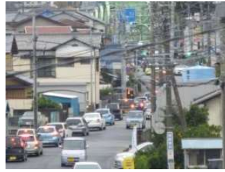
富士川橋東側の渋滞 (先に見えるのが富士川橋)

富士川を渡る車の一部が新橋を利用するため「富士川橋」を渡る車の台数が2/3程度になると予想。このため、 富士川橋で発生している渋滞を大幅に減らします。