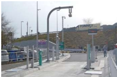
富士川 スマートインター

富士川の西と東の行き来をしやすくするだけでなく、富士川スマートインターチェンジ（富士川楽座）を中心とした、 観光や産業の活性化も期待。