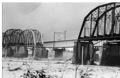
昭和57年の台風で流された 現JRの富士川鉄橋