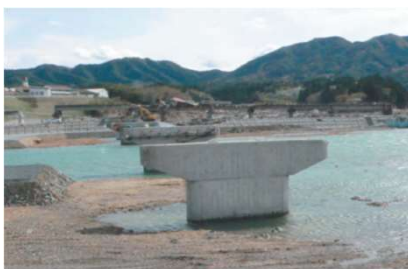
津波で落ちた橋 (東日本大震災)

地震などで大きな被害が発生した場合、自衛隊や消防などの緊急車両、食料を積んだトラックなど、多くの車両を受け入れる新々富士川橋は、 重要なルートの一部。