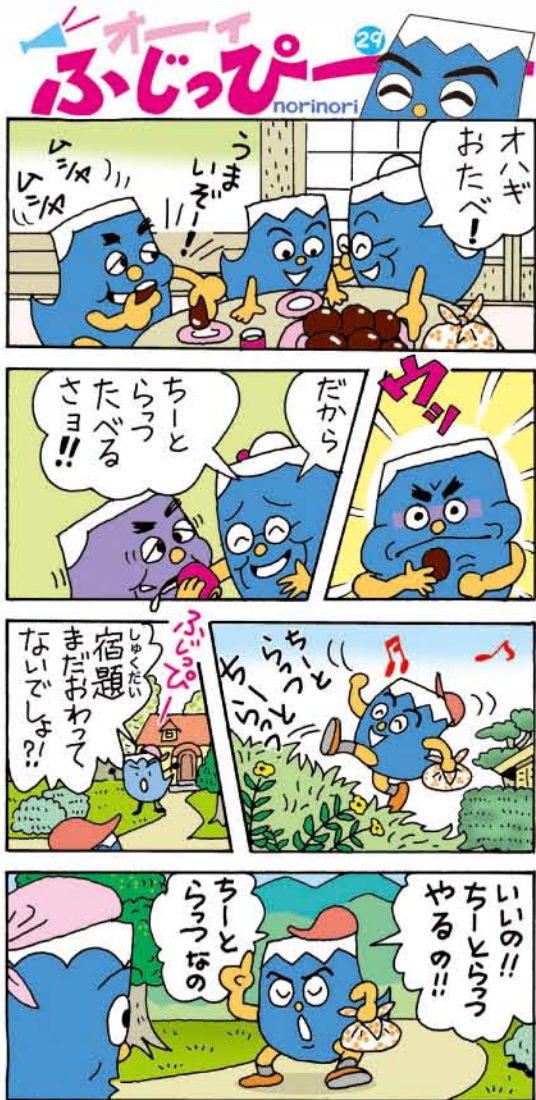
*ちーとらっつ=すこしずつ