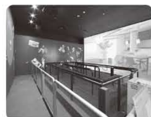
▲地震の揺れを映像を見ながら体験する「地震体験装置」

新設された風水害ゾーンでは、河川災害や土砂災害が発生する仕組みや、台風への事前の備え、風水害から命を守る行動について、解説パネルやモニター映像を通して学ぶことができます。また、お住まいの地域のハザードマップを確認できます。