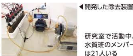
◀開発した除去装置