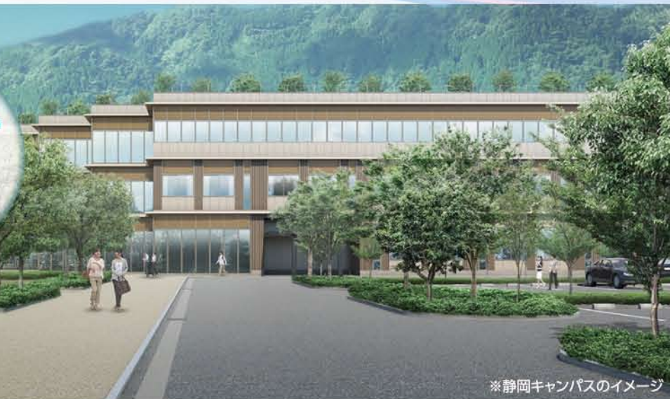
※静岡キャンパスのイメージ