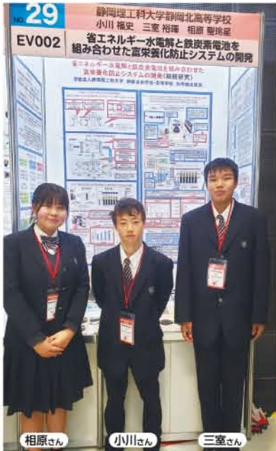
学校法人静岡理科大学 静岡北高等学校 科学部

受賞後に特許も出願しているこの装置。シンプルな構造のため、将来的には途上国での運用にも期待が持てるという。「学びの場」という泉から湧き出た小さな支流が、やがて大河となる。