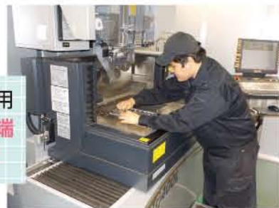
▲金属部品加工実習