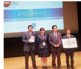
▲「JFEスチール賞」の受賞式