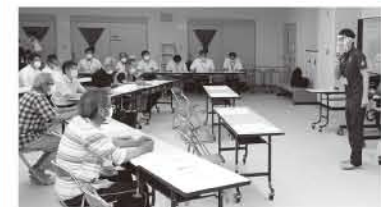
▲住民検討会の様子(7月22日 河津町)