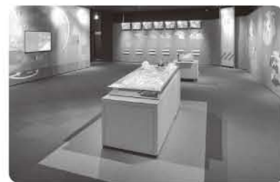
▲風水害ゾーンの展示