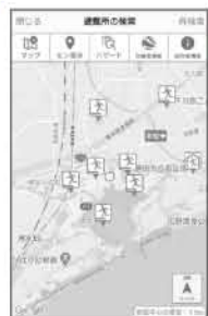
ハザードマップと避難所を同時に確認できます