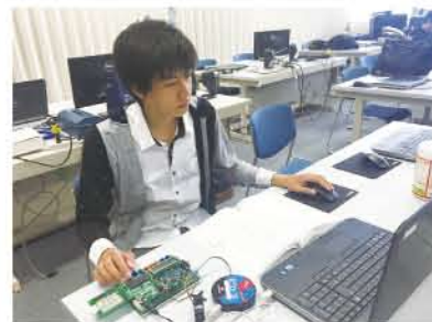
▲制御プログラムの開発実習

誰もが学ぶことができる 全国一安い※授業料 (年額234,600円) ※全国の職業能力開発短期大学校との比較(平均約38万円)