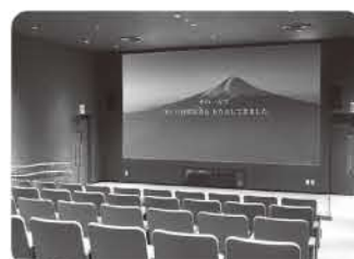
▲大型スクリーンで災害の脅威を学べる「ふじのくに防災シアター」

開館から30年以上の間、地震災害について啓発してきた県地震防災センターが、今年6月にリニューアルオープン。地震・津波に加え、豪雨災害や火山災害に関するゾーンを新設しました。本県は降水量が多く、大雨に伴う水害や土砂災害が繰り返し発生しています。そこに暮らす私たちにとって身近な災害を、より詳しく学べるようになりました。