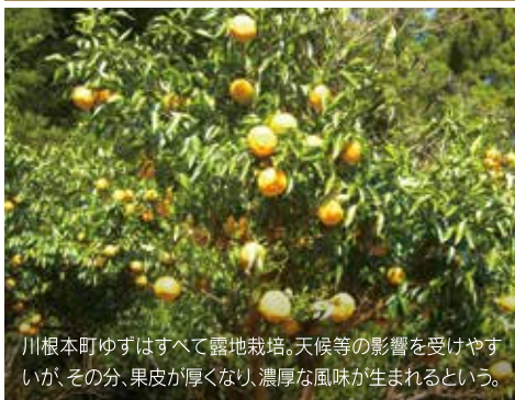
川根本町ゆずはすべて露地栽培。天候等の影響を受けやすいが、その分、果皮が厚くなり、濃厚な風味が生まれるという。