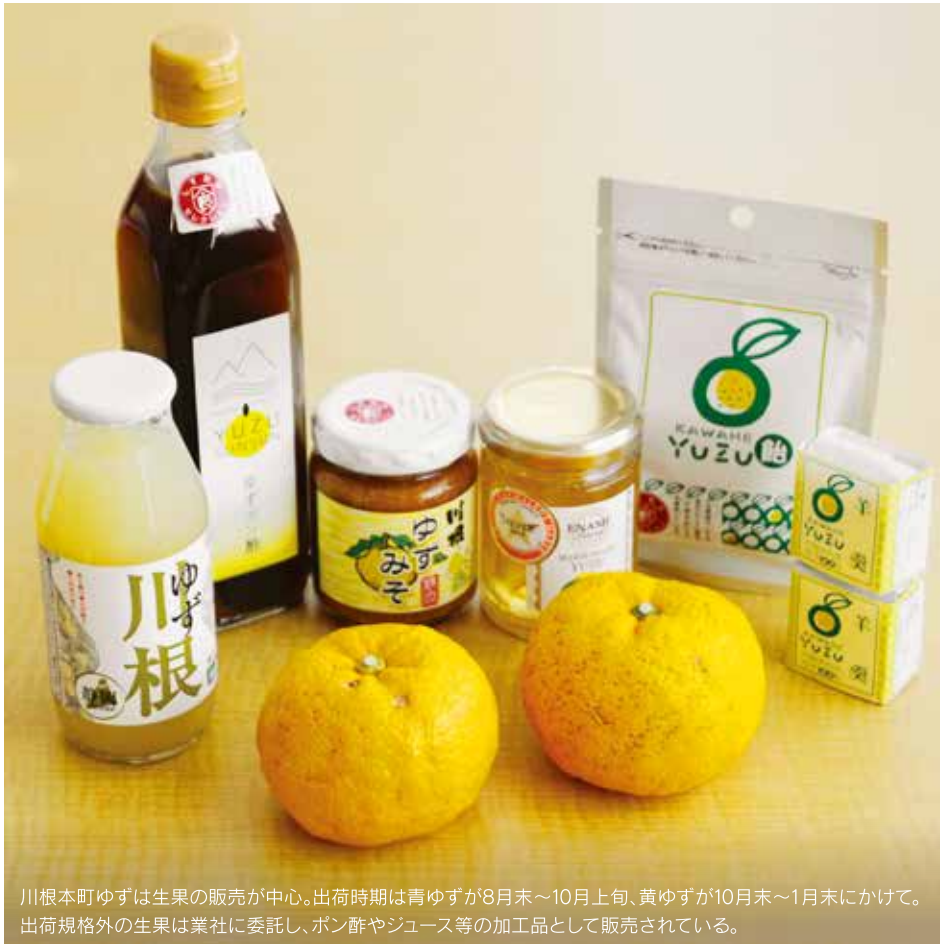
川根本町ゆずは生果の販売が中心。出荷時期は青ゆずが8月末～10月上旬、黄ゆずが10月末～1月末にかけて。出荷規格外の生果は業社に委託し、ポン酢やジュース等の加工品として販売されている。

和食はもちろん、洋食やスイーツとの相性も良い「川根本町ゆず」は、ポン酢、ジャム、和菓子等の加工品もブレイクの兆し。お茶と並ぶ名産になる日も近いだろう。