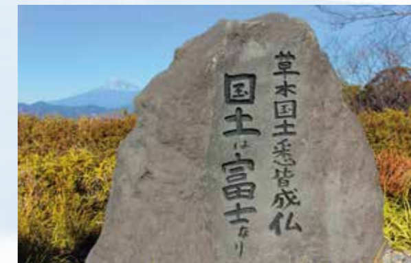
梅原猛先生の揮毫による石碑。「草木国土悉皆成仏(そうもくこくどしつかいじょうぶつ) 国土は富士なり」とある。