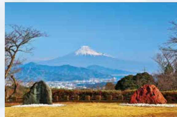
富士山を眺望する日本平山頂に並んで設置された石碑。左が梅原猛先生の揮毫によるもの。右は中曽根康弘元総理による「富士山」の揮毫。