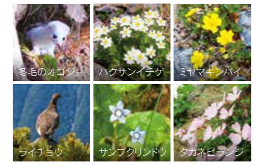
南アルプスを彩る花々と希少な動物たち。

南アルプス最大級のお花畑である「荒川のお花畑」。7月中旬から下旬にかけて、ハクサンイチゲ(白色)とシナノキンバイ(黄色)を主体としたお花畑が広がる。