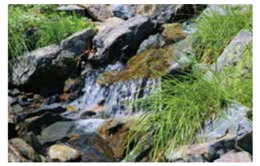
荒川岳 標高約2700mの湧き水。

南アルプス最大級のお花畑である「荒川のお花畑」。7月中旬から下旬にかけて、ハクサンイチゲ(白色)とシナノキンバイ(黄色)を主体としたお花畑が広がる。