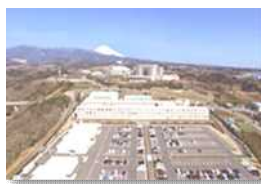
研究開発施設の整備

内陸部において地域資源と高規格幹線道路を最大限活用した災害に強く魅力ある地域を創出する事業。