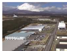
環境重視型工業団地の整備