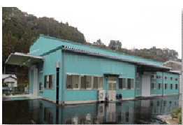
農産物加工施設の整備

企業の内陸移転や既存施設・遊休地の利活用により、沿岸域における減災と産業転換を両立する事業。