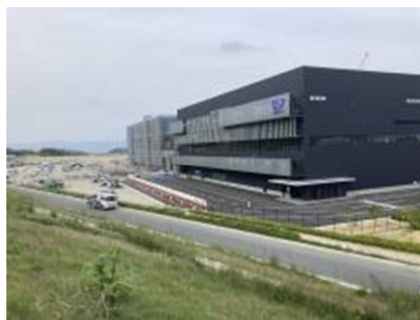
工業用地の整備状況（湖西市）

土地区画整理事業及びアクセス道路整備への財政支援により工業用地等の整備が進捗した。区画整理事業については、全体面積31.5ヘクタールのうち令和4年度までに29.2ヘクタールの造成が完了し、自動車用電池を生産する企業の進出が決定している。令和4年度は、進出企業による工場建設が行われ、広大な敷地全体は「KOSAI・Battery・Park（コサイ・バッテリーパーク）」と命名され、脱炭素化、自動車の電動化の世界的な潮流の中、車載用電池の一大生産拠点として次世代のものづくりの大きな役割を果たすことが期待されている。アクセス道路整備については、令和5年度の進出企業の操業開始に合わせ順調に進捗している。また、区画整理事業やアクセス道路整備に伴って発生した残土は、防潮堤や命山等の整備に有効活用されている。進出企業では、1,000人以上の雇用が見込まれていることから、湖西市では、住宅取得の奨励