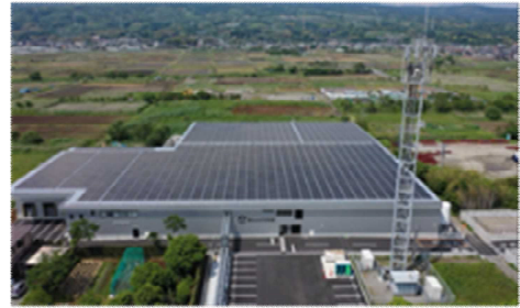
整備された植物工場（沼津市）

なる水耕栽培によるハウレンソウは、365日季節を問わず種をまいてから約35日で出荷可能で、生産量は年間最大1,000トンを見込んでいる。屋根には太陽光パネルを設置し、電力の約2割を賄うとともに空調などを自動管理する新開発の環境制御システムも導入し、使用電力を従来比で約5割削減する計画である。令和4年度は「ふじのくにフロンティア推進エリア形成事業費補助金」を活用し、蓄電システムを導入した。