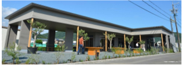
整備された農家レストラン（藤枝市）

オリーブ園を軸に、食と農、観光を組み合わせ地域活性化の拠点づくりが進行しており、数値目標「6次産業化等の新規取組件数」及び「移住相談窓口等を利用した県外からの移住者数」に寄与している。