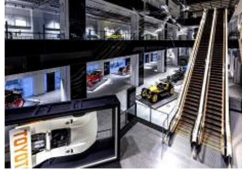
ホテル内にレース車両を展示（小山町）

県や町の企業立地支援策などを活用して事業を推進していく。富士スピードウェイ周辺の開発については、温浴施設や地元食材を使ったレストランの建設も計画されている。また、富士スピードウェイでは、キャンプをしながらのレース観戦やドライビング教室など、レースファンに限らず大人から子供まで楽しめる新たな体験コンテンツを計画しており、年間100万人の来場者（現状70万人）を目指している。本地域の周辺は、富士スピードウェイのほかにもアウトレットモールや富士山などの観光資源が集約している。現在建設中の新東名高速道路（新御殿場IC－新秦野IC間）が開通することで、東京から車で約1時間となることから、近い将来大きく変貌を遂げることが期待される。