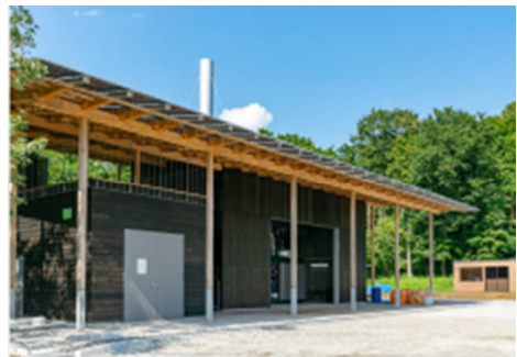
木質バイオマス発電施設（小山町）

今後の取組としては、売電事業をベースに排熱を有効活用する売熱事業合併モデルの構築を進めている。令和4年度は、木質バイオマス発電熱利用施設として“ふじのくに”のフロンティアを拓く取組における地域循環拠点区域に2施設が認定された。認定された施設は、木質バイオマス発電施設で発生する熱を利用し、木質ペレットを製造する施設。製造された木質ペレットを燃料にバイオマスボイラーによる温泉加熱を行う施設となっている。木質バイオマス発電施設などに利用される木質ペレットの原料となる未利用木材の供給体制を整え、地域森林資源の循環利用と再生可能エネルギーの導入促進を地域全体で展開していく。