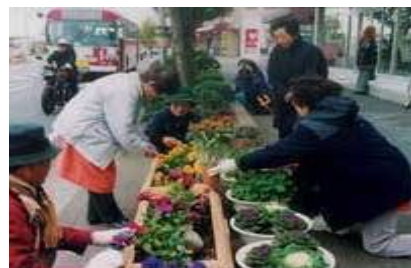
袋井駅前商店街協同組合の皆さんが道路を花で飾っています！

平成13年度から、各地域の団体の協力を得て、道路の清掃や除草、草花の維持管理などの美化活動をしていただく「しずおかアダプト・ロード・プログラム」を進めています。県では、協力団体の表示看板や保険の加入、道具の支給などにより、団体の活動を紹介、支援しています。