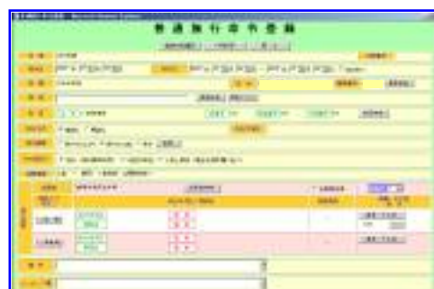
出張はこの画面から登録します！