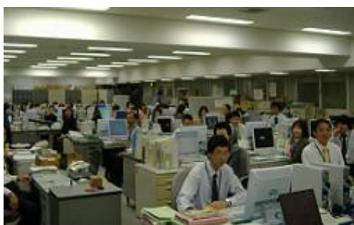
総務事務センター

これまでの取組により、平成 10 年度からの累計で職員を 97 人削減することができました。また、経費換算すると約 45 億 7,000 万円の削減効果がありました。