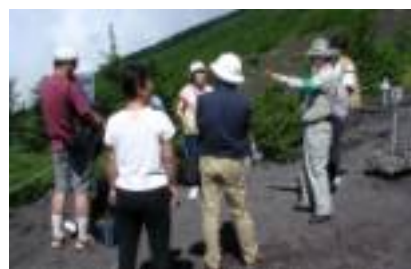
「富士山エコレンジャー」が来訪者にマナー向上を呼び掛けています！

富士山の環境保全を行うグループ、企業、マスコミ及び県などからなる「ふじさんネットワーク」では、「富士山エコレンジャー」を組織し、来訪者へのマナー啓発に取り組んでいるほか、小学生を対象とした環境学習を行うなど、 協働による富士山の環境を守るための様々な活動を実施しています。