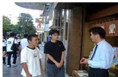
大人から進んで青少年にあいさつするなど、積極的にかかわっています！