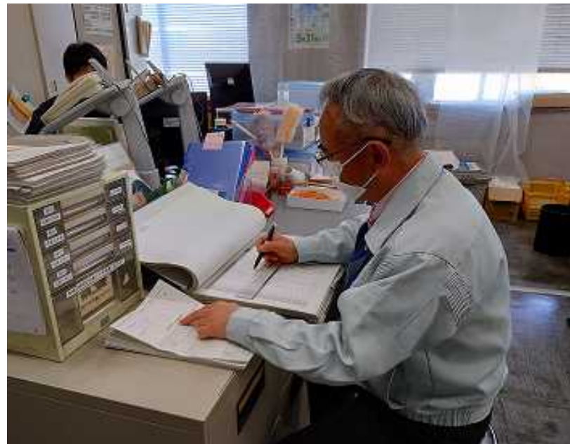
紙台帳への提出状況記載