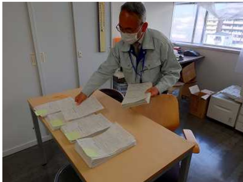
整理番号順並び替え作業