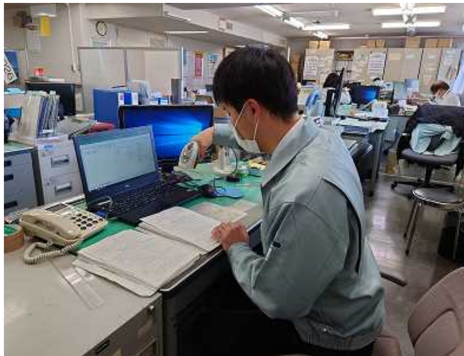
QRコード読取による入力作業