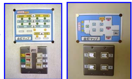
【点灯マップの掲示】