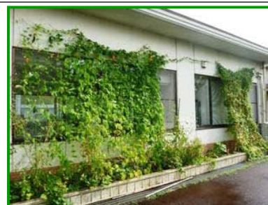
【緑のカーテンの設置状況】