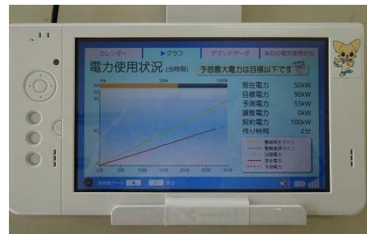
【デマンド装置のモニター画像】