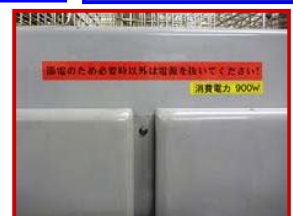
【電力消費量の掲示】(同用途機器の差)