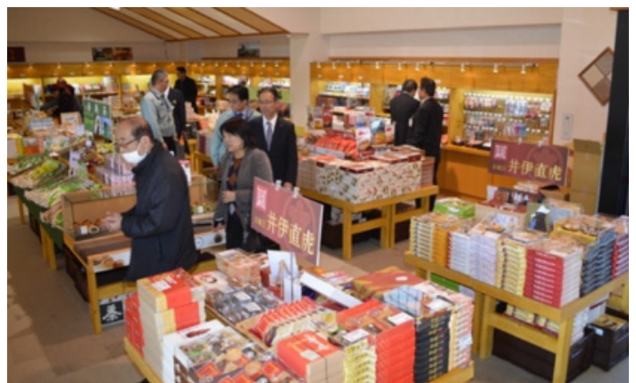
【直虎ショップの様子(静岡新聞アットエスから)】