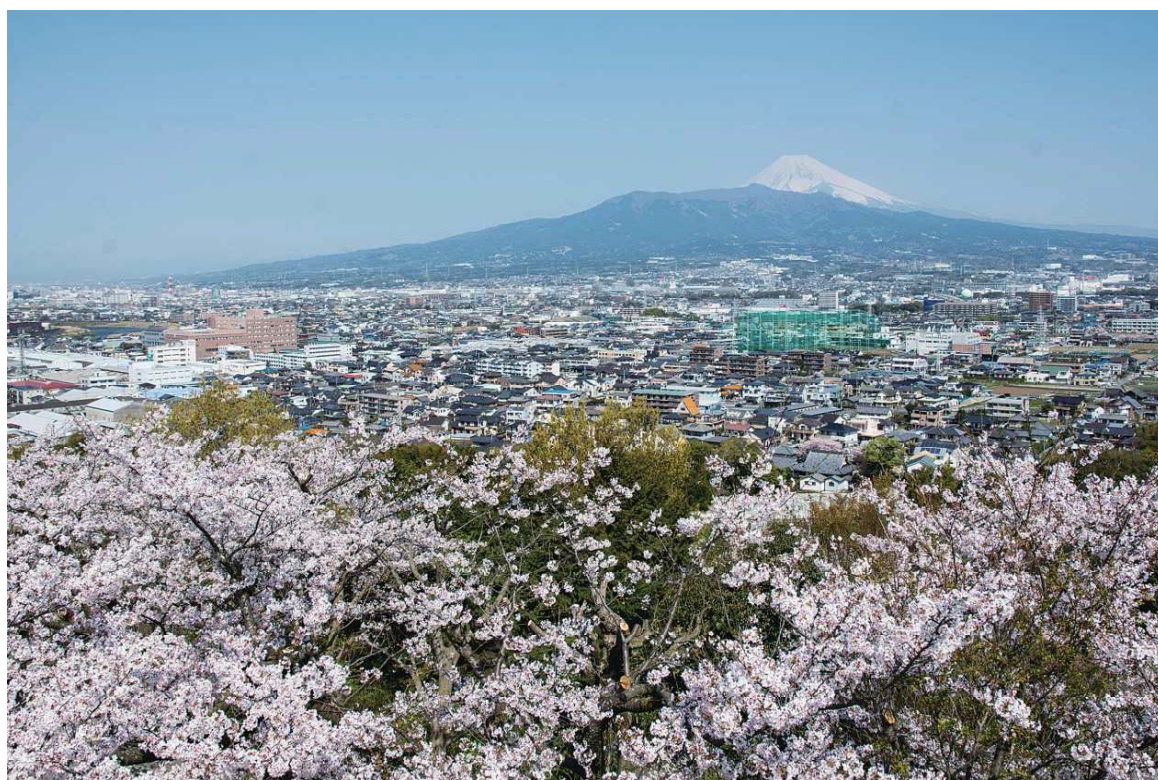
本城山から見た富士山（清水町）