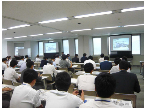
「施設紹介フェア2019」@県庁（43事業者75人が参加）