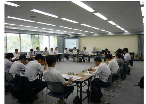
「指定管理者制度ワーキング」