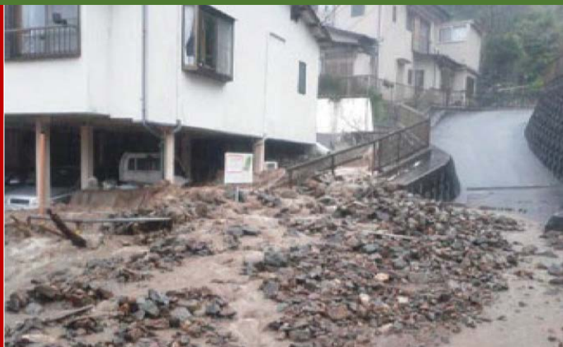
Enxurrada que foi para a estrada em abril de 2017 (local: cidade de Shimoda)

No Japão, chuvas fortes podem causar o colapso de montanhas, enxurradas de terra e pedras para as casas e estradas.