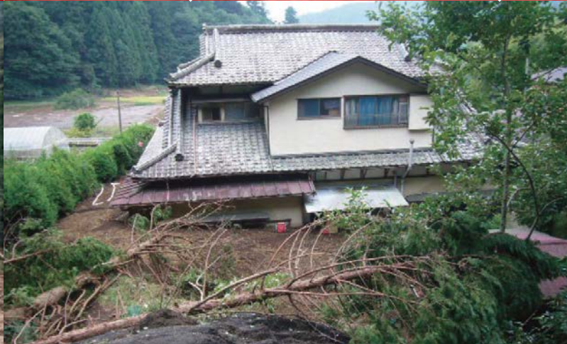
Sedimentos e árvores foram arrastados pelo tufão em setembro de 2010 (local: cidade de Oyama)

Shizuoka-ken Keizai Sangyou-bu Shinrin • ringyou-kyoku Shinrin Hozen-ka 静岡県 経済産業部 森林・林業局 森林保全課 Governho Provincial de Shizuoka, Departamento de Economia e Produção, Seção de Indústria Florestal, Divisão de Conservação Florestal