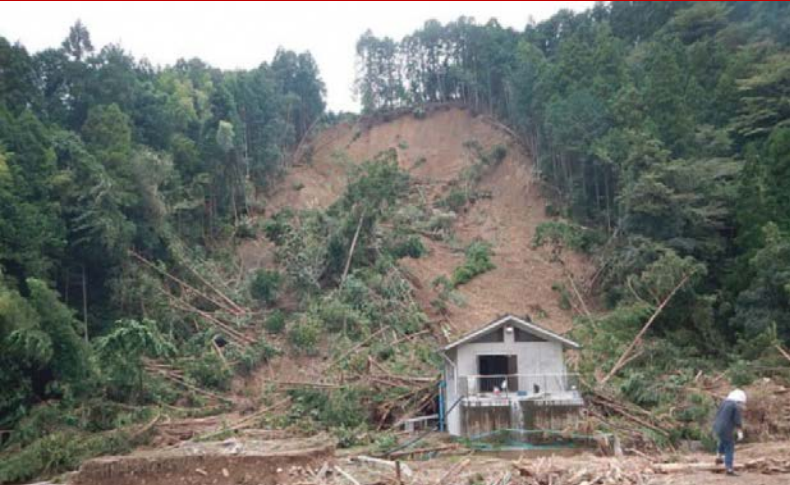
A montanha desabou devido a um tufão em outubro de 2014 (local: cidade de Shizuoka)