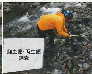
爬虫類・両生類調査