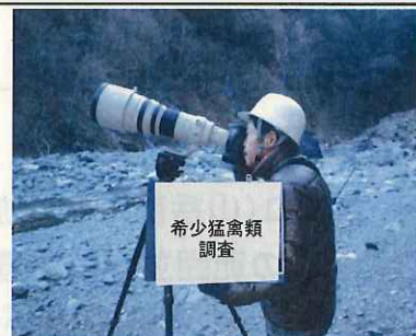
希少猛禽類(定点観察法)