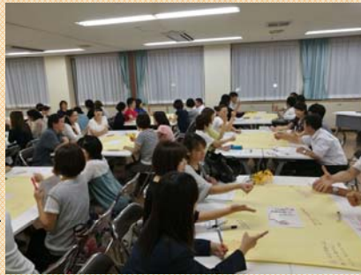
楽しみながら子育てについて学びます