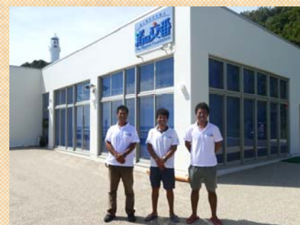
渚の交番とスタッフの方々