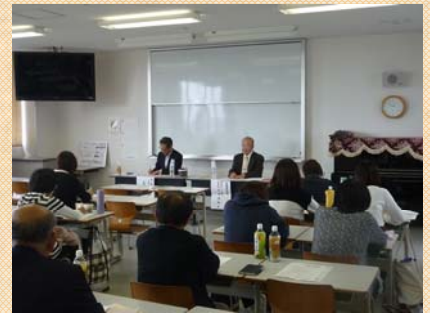
学会総会、セミナーには、様々な分野の方々が集まりました