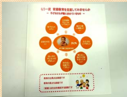
親が子どもの気持ちをすべて汲み取るのは難しいですね（リーフレット）