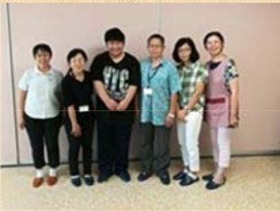
ボランティアのみなさん