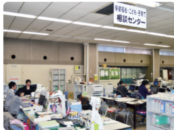
大仁庁舎に入ってすぐ、わかりやすい場所にある相談センター。専門職が机を並べることで情報共有しやすく対応も早くできるそう。

平成27年4月に伊豆の国市役所大仁庁舎内に開設された「保健福祉・こども・子育て相談センター」。家庭が抱える複雑化、多問題化した相談等に対応するため、これまで社会福祉、障がい福祉、長寿福祉、健康づくりなどの複数の課で対応していた市民の困りごとを、相談センターに集約。赤ちゃんから高齢者まで、ひとつの窓口で相談に対応する先進的な取組です。当事者以外にも民生委員やご近所の家庭を気にする住民が窓口を訪ねることもあります。職員21名のうち13名が保健師や様々な分野の専門職。地域包括支援センターなどの専門機関とも連携。ワンストップで相談、サポートを受けられる場所としてその存在が市民に浸透してきました。