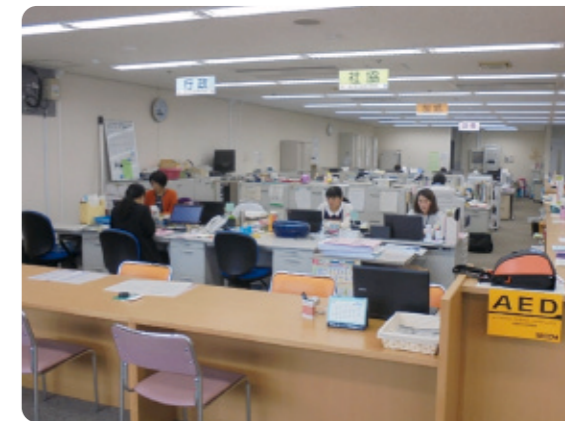
4つの団体が仕切りのないワンフロアに集結。見通しのよいフロアでそれぞれの職員の動きもよくわかります。

“健康子育て日本一のまちづくり”に取り組んでいる掛川市。その一端を担う存在が市内5カ所にある地域健康医療支援センター「ふくしあ」です。市民からの相談窓口となり、支援の全体コーディネートを担当する「行政」、主に高齢者を支援する「地域包括支援センター」、地域力の育成や見守りのネットワークを作る「社会福祉協議会」、在宅医療を支える「訪問看護ステーション」の4団体が集結。住み慣れた地域で、安心して最期まで暮らすことができるよう、医療、保健、福祉、介護が一体となった体制で市民を支えています。市内を5つのエリアに分けることで地域に密着し、同じフロアに専門職が集い情報共有を図ることによって、困りごとを抱える市民に迅速かつ的確に対応することができるようになりました。