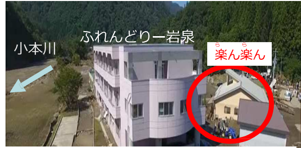
写真)「平成28年8月岩手県岩泉町の介護老人保健施設の被災動画」国土地理院撮影

○平成28年8月30日の台風第10号の雨による岩手県小本川の水害で「グループホーム楽ん楽ん」で入居者9名が亡くなる大きな被害が発生