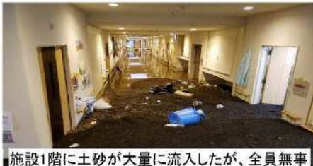
施設1階に土砂が大量に流入したが、全員無事