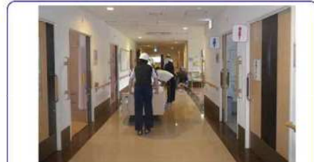
令和元年6月同施設での避難訓練実施状況