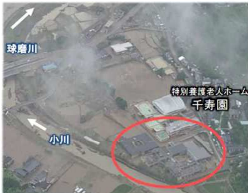
被災場所: 熊本県球磨村