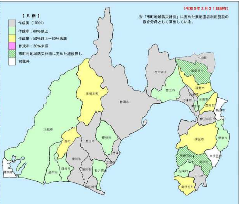
県内市町別の状況 (国資料を基に土木防災課にて集計)