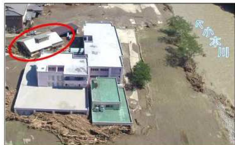
平成28年台風10号により、岩手県の要配慮者利用施設では利用者9名の全員が死亡。