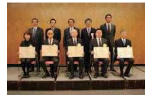
健康づくり活動に関する 表彰式