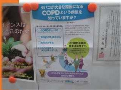
禁煙ポスター掲示