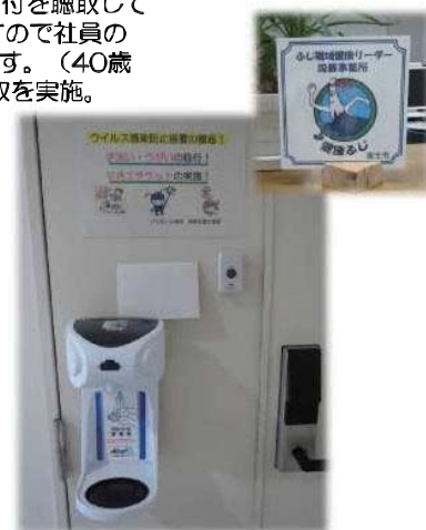
啓発ポスター 入室時アルコール消毒機