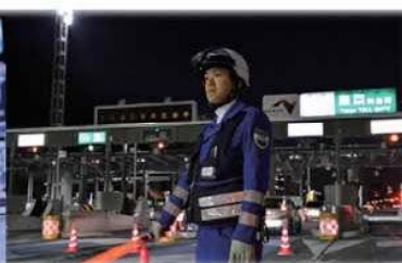
法令違反車両取締等業務