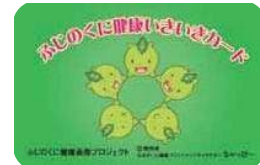
ふじのくに健康いきいきカード