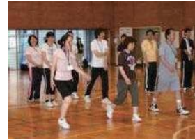
ふじ33プログラム実践教室

運動習慣や食生活の改善に加え、積極的な社会参加をメニューに取り入れたふじ33プログラムの普及や本県に多い脳血管疾患の予防に向け、生活習慣改善を促進する減塩55プログラムの普及を行います。