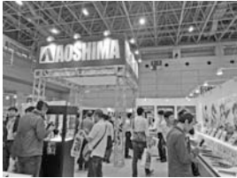
▲昨年の会場内の様子