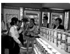
▲昨年度の様子 (グループ別研修： 杭州大廈（複合 商業施設）)

県教育委員会は、「日中青年代表交流」の参加者を募集しています。現地青年との交流や企業視察等、個人旅行では決してできない体験を通して、中国の現状を知ることができます。また、産業、行政、教育等様々な分野で活躍する県内参加者との交流も生まれます。今年度は、中国最大の港湾都市・寧波市を訪問します！