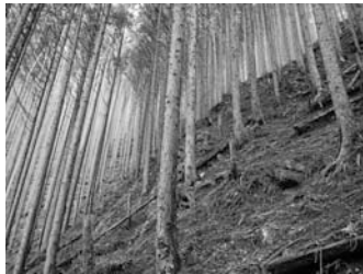
▲手入れ不足で荒廃した人工林の間伐