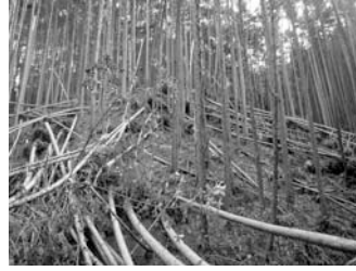
▲倒木被害を受けた人工林の片付け