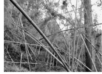
▲放置竹林や過密な広葉樹林の伐採

【お問い合わせ】 経済産業部 森林計画課 森の力再生班 電話:054-221-2613