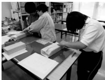
▲過去の体験入校の様子