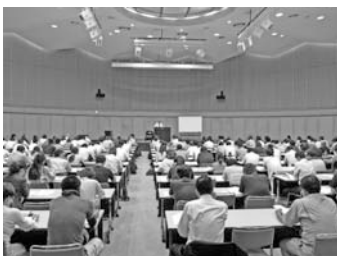
▲過去の講習会の様子

受発注取引において、困ったことはありませんか？ 静岡県産業振興財団では、下請法で定められている「買いたたき」、「減額」といった禁止事項、取引上の注意点などトラブル防止のポイントを分かりやすく解説します。