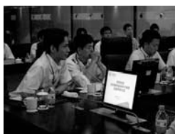
▲昨年度の様子 (現地企業視察： 中国移动通信)