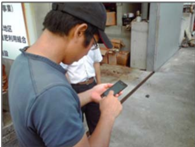
スマホで浄化槽の状況を確認