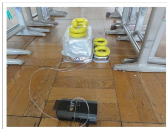
写真1 床のVOCs放散状況調査（学校施設内一般教室）