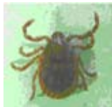
フタトゲ チマダニ

じゅうしょうねつせいけっしょう ばんげんしょうしょう 重症熱性血小板減少症 こうぐん 候群(死亡事例あり)を 引き起こしているマダ ニの分布 かいめい を解明