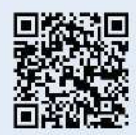
来場申込用 QR コード

★お申込み： https://www.robo-navi.com/webroot/siersdayapplication/159.php