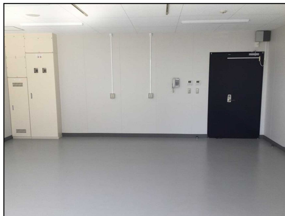
入口側 (窓側から撮影)