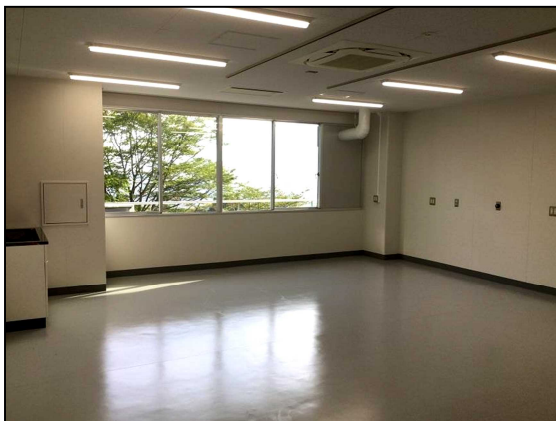
窓側 (入口から撮影)