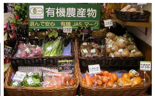
静岡県経済産業部 農山村共生課