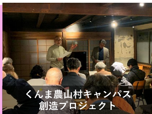
くま農山村キャンパス 創造プロジェクト