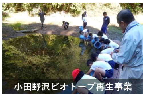
小田野沢ビオトープ再生事業