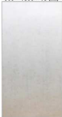
プロコンパネル (透水シート貼り型枠合板) 900×1800×13 (mm)