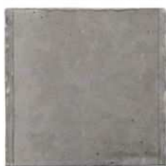
プロコンパネル使用