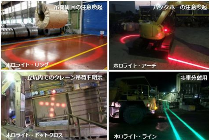
<労働災害を低減する安全用注意喚起照明 使用事例>