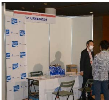
大塚製薬(株)ブース