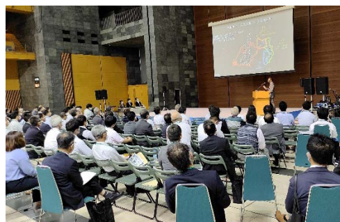
興味深く講演に聞き入る聴講者の様子