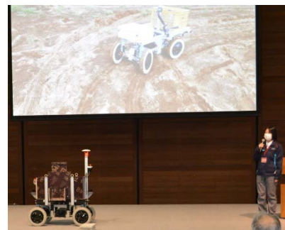
出展者によるショートプレゼンテーション