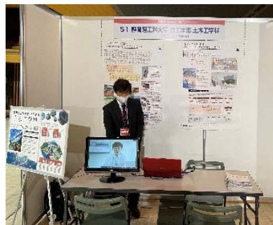
静岡理科大学ブース

静岡理科大学、大塚製薬(株)、静岡県交通基盤部が静岡どぼくらぶ広場にブース出展し、取組をPRしました。