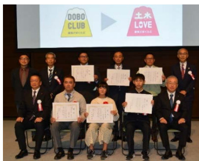
受賞者による記念撮影