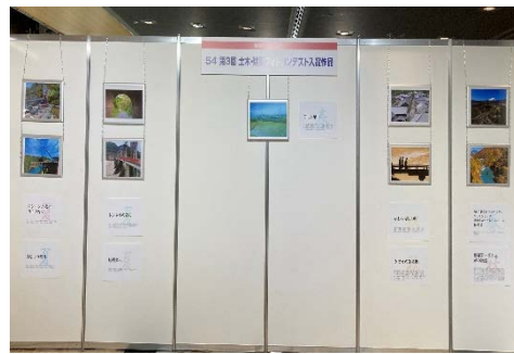
入賞作品の展示状況