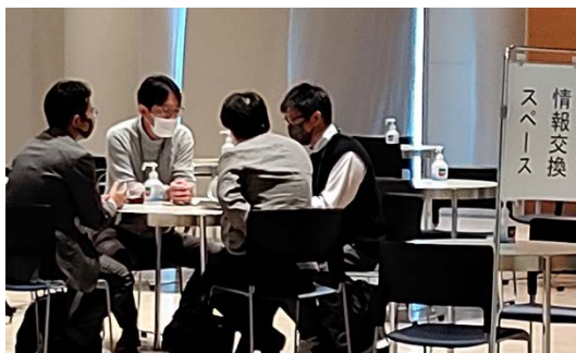
熱心に情報交換する出展者と来場者