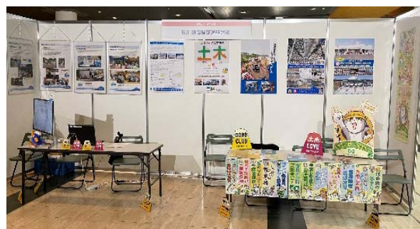
静岡県交通基盤部ブース