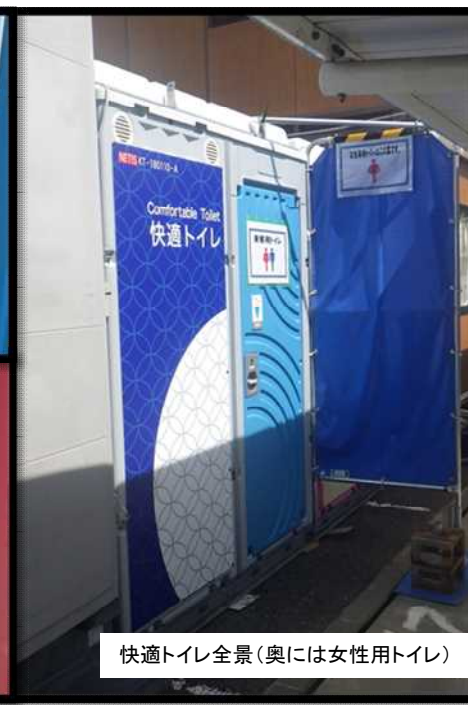
快適トイレ全景(奥には女性用トイレ)