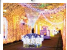
⑥ 御殿場高原時之栖