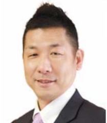
御殿場市長 若林 洋平

富士山周遊や、市内観光にお越しの際は、ぜひ新しい玄関口となる「駒門スマートIC」をご利用いただければ幸いです。