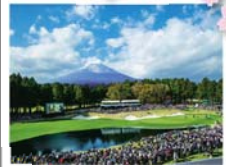
④ 太平洋C C