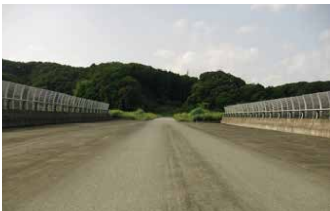
ランプ橋(新東名跨道橋)から北を望む