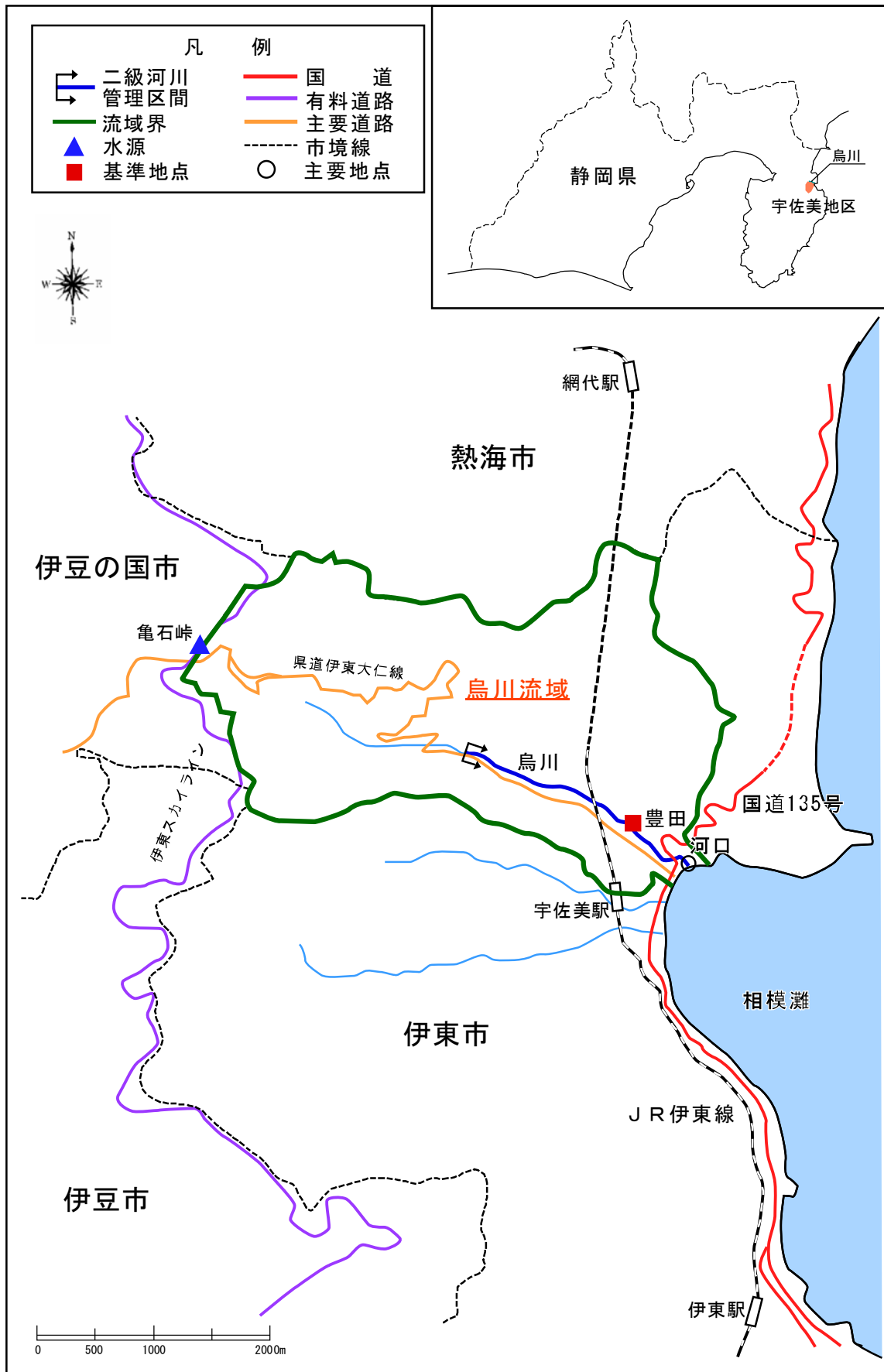
(参考図) 烏川水系図