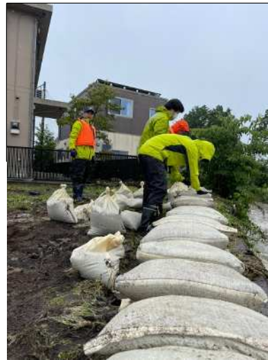
久保川左岸(竈地先) 土のう積