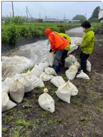
久保川左岸(竈地先) 土のう積