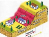
きゅうけいしやち 急傾斜地の崩壊【B】