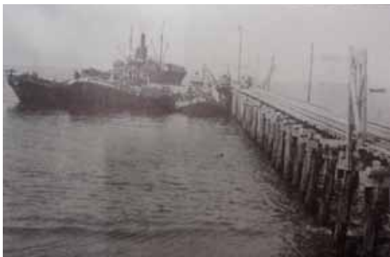
金鉱石が棧橋で船積みされた頃の様子

海上交通は、古くは汽船が運航され場所によっては「はしけ」による乗り降りの時代もあったようですが、後に沼津より就航していた「龍宮丸」など幾多の変遷を経て、昭和46年にカーフェリーが土肥一田子の浦港間に就航し、平成14年に土肥一清水間 りゅうぐうまる に航路変更されました。また、高速旅客船が昭和49年に沼津一松崎間に就航し、現在は沼津一土肥間で運行されています。