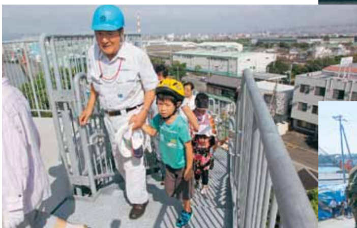
津波避難タワーへの避難訓練