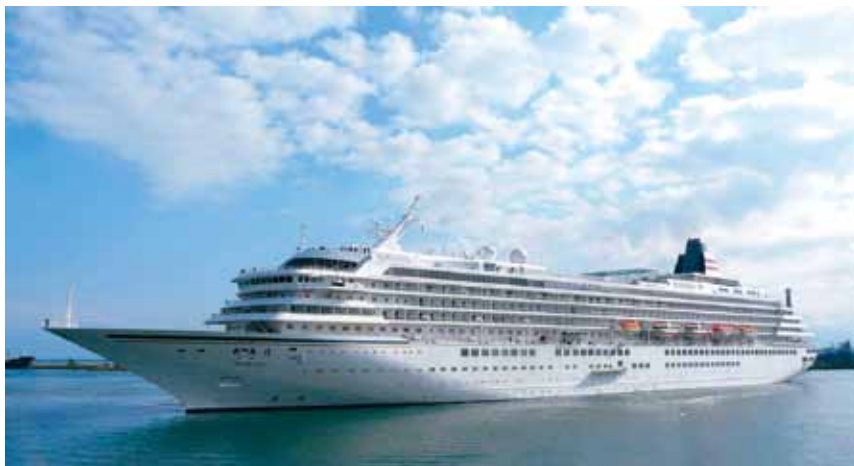
クルーズ客船「飛鳥II」

江戸時代の浮世絵にも描かれ、国内外に広く知られている富士山と駿河湾の織り成す絶景や、三保松原、白糸の滝をはじめとする自然景観と、桜えびやしらすなどグルメを組み合わせた周遊観光ルートなどをセールスポイントに、引き続き官民一体となってクルーズ客船の誘致を一層促進していきます。