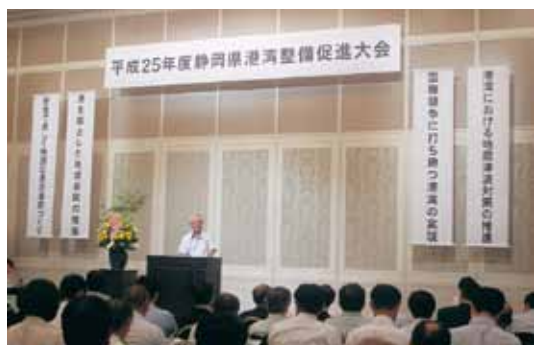
西原副会長（牧之原市長）による決議の読み上げ