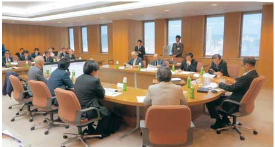
昨年11月5日に開催した3沿岸合同での検討委員会の様子

見直しに当たっては、学識者・地元代表者及び市町長から構成される「海岸保全基本計画検討委員会」を設置し、様々な観点からご意見をいただきつつ、本年3月の変更・公表に向けて検討作業を進めています。