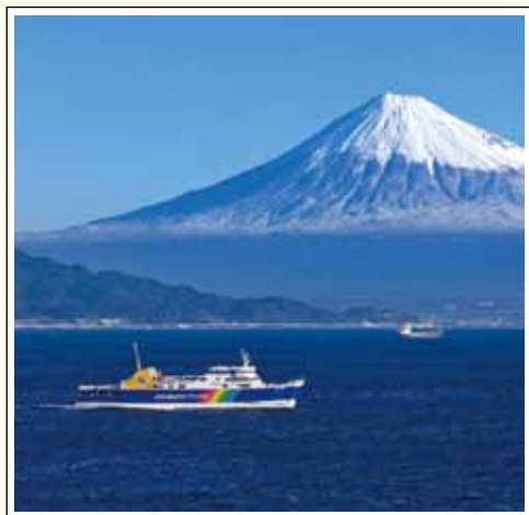
県道223号(駿河湾フェリー)

また、海上からの富士を望むことが出来る、清水港と土肥港を繋ぐ駿河湾フェリーのルートが「県道223号 ふじさん 」として路線認定されました。観光目的の海上県道は全国初であるため話題を呼び、多くの観光客が清水港を訪れるきっかけの一つになっています。