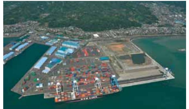
清水港新興津地区(平成25年9月)

平成10年11月には、興津連合自治会から『清水港港湾整備計画に係わる要望書』が提出され、これに基づき清水市・静岡県は平成11年3月に同要望書に対