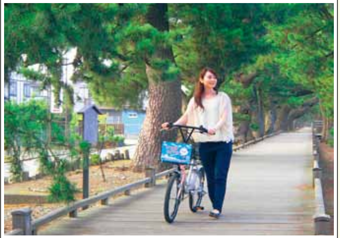
御穂神社から三保松原へ続く神の道

三保松原は約4kmの海岸線に5万本の松が茂る日本三大松原のひとつです。万葉集以降多くの和歌や絵画、浮世絵の題材となり、文化的・芸術的価値が認められ富士山世界遺産の構成資産として登録されました。その三保半島を清水港内の水上交通とサイクリングやウォーキングで気軽に楽しんでいただこうと、平成26年3月までの土日祝日、無料水上バス「ちゃり三保号」を運航しています。水上バスは自転車乗船料も無料で、乗り場近くや三保半島内の施設ではレンタサイクルもできます。船上から富士を仰ぎ、世界遺産構成資産（三保松原）と周辺の見どころ、食べどころをゆっくりと巡る旅が注目を集めています。