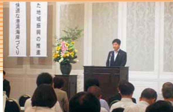
田辺会長（静岡市長）あいさつ