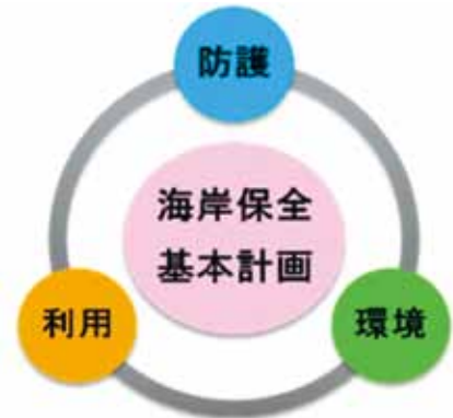
総合的な海岸の保全イメージ

海岸保全基本計画とは、海岸法の改正（平成11年）に伴い、「美しく、安全で、いきいきとした海岸の継承」を基本理念とする国の定めた基本的な方針に基づき、海岸の災害からの“防護”に加え、“環境”の整備・保全及び適正な“利用”にも配慮し、総合的に海岸の保全を実施するため、都道府県が定める基本計画のことです。静岡県では、平成14年から15年にかけて「伊豆半島沿岸」、「駿河湾沿岸」、「遠州灘沿岸」の3沿岸で策定した基本計画に基づき、海岸の保全の取り組みを行っています。