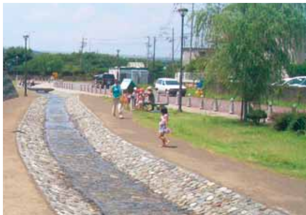
新興津緑地で遊ぶ園児たち

現在、新興津CTとしては、前面の新興津防波堤や第2バース背後のコンテナヤードは未完成ではありますが、新興津CTが提案され第2バースが出来上がるまでの四半世紀の間に、興津連合自治会の役員の方々と接することができたことは、私にとって非常に貴重な体験をさせていただいたと感謝しております。