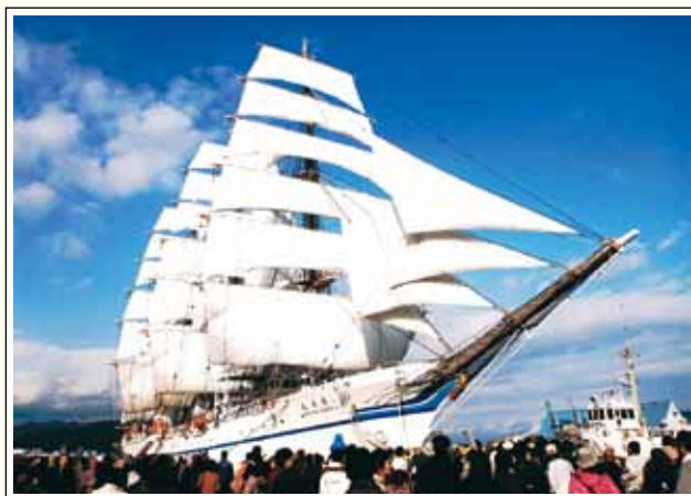
帆を広げた日本丸(日の出埠頭)

「清水港・みなと色彩計画」に基づきアクアブルーとホワイトで統一され、富士山を借景とする日本三大美港の清水港は、「清水港客船誘致委員会」の活動により、大型客船や帆船が寄港し、毎年秋には独立行政法人