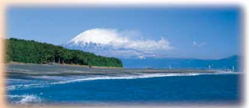
三保の松原と富士山