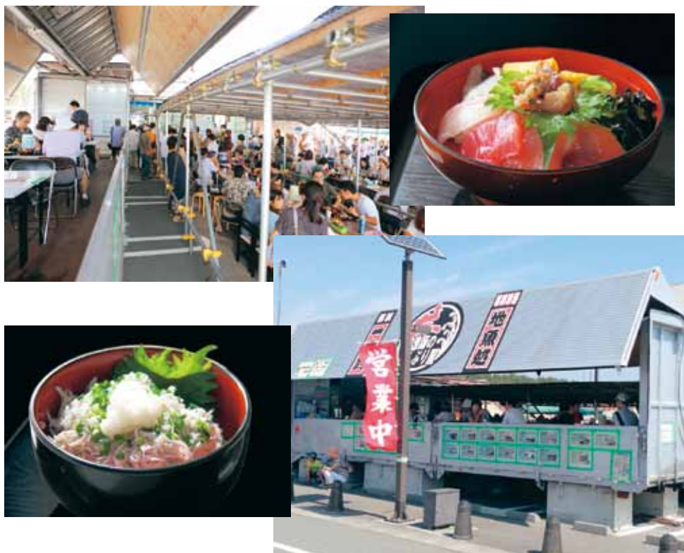
地魚処「漁師のどんぶり屋」

遠州灘は、気象・海流の変化が激しく、海の難所と言われてきましたが、その激しい流れや、太田川、天竜川からの豊富な河川水の流入は、魚の成育に適した環境でもあり、身の締まった魚や貝がたくさん獲れます。磐田市の南東部・豊浜地区に位置する福田漁港では、シラス漁を中心に、遠州灘を漁場とした沿岸漁業が盛んに行われています。この豊かな水産資源を生かした福田漁港周辺地域の活性化を目指すため、現在、磐田市が様々な取り組みを行っています。