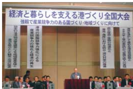
経済と暮らしを支える港づくり全国大会の様子