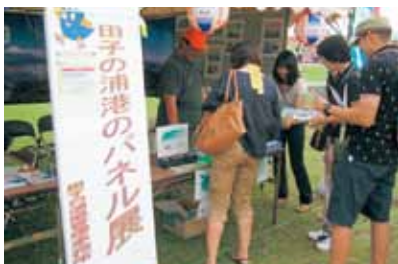
行政機関のパネル展