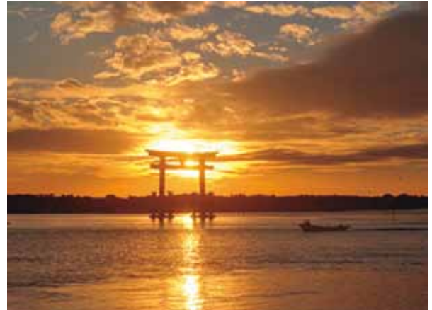
(浜名湖弁天島の夕陽)

周辺を海に囲まれたわが国には、1,000以上の港が存在しており、輸入物資の9割以上が港を介して国内に流通しております。また、災害時において、海路は陸路に代わる輸送路となり、私たちの生活を維持するために、重要な役割を担っております。