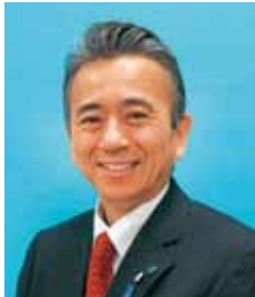
静岡県港湾振興会評議員 浜松市長 鈴木 康友