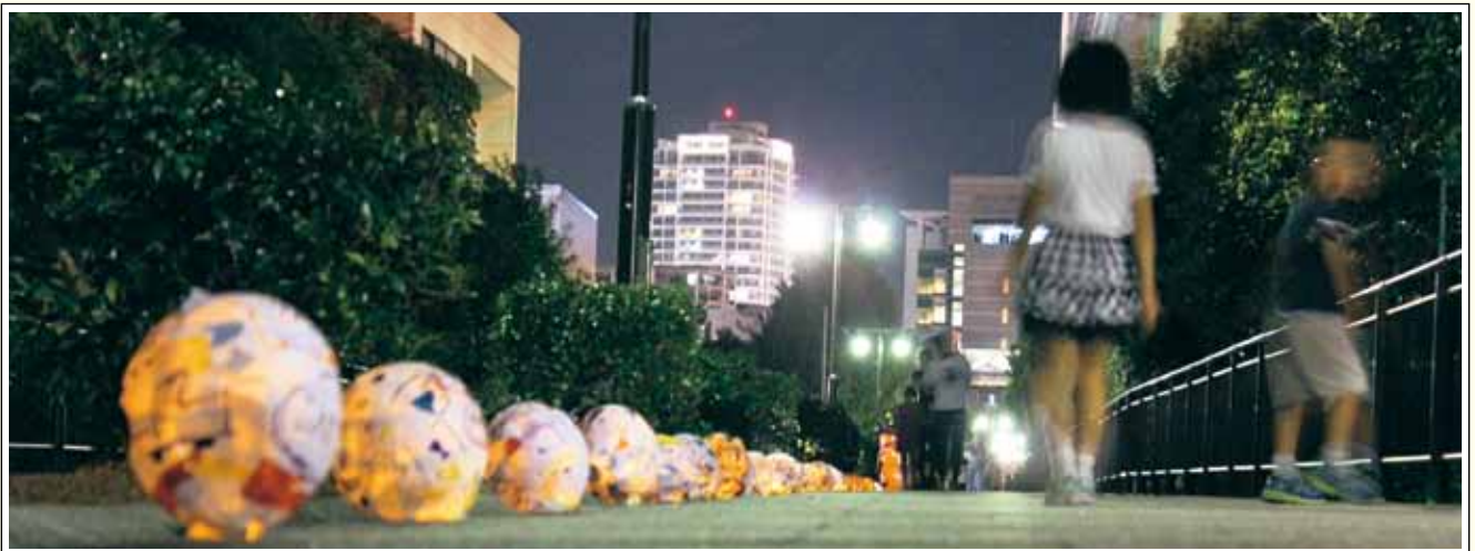
ランプシェードを使用した遊歩道ライトアップ

しかしながら、これらの賑わい創出拠点は点であり線ではありません。この点を繋ぎ線にして、回遊性を作り出すために、JR清水駅と三保半島を結んでいた旧国鉄清水港線跡地を利用した「遊歩道」（自転車歩行者道）の活用を推進し、まずは江尻地区と日の出地区を結び、官民連携したみなとの賑わい創出を目指しています。