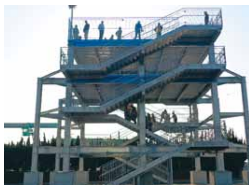
「振興会会員による避難訓練の様子(昨年12月実施)」