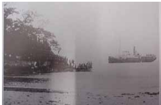
屋形弁天の船着場