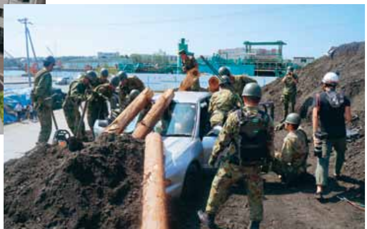
土砂崩落救出訓練