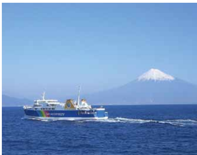
海上からの富士山

清水－土肥航路は、全国的にも例のない海の県道として平成25年4月に「 ふじさん 県道223号清水港土肥線」に認定され、平成25年6月には、富士山が「世界文化遺産」に登録されたことから、同フェリーの注目度は、各段に高まっています。海上から見る富士山の美しさは、また格別です。