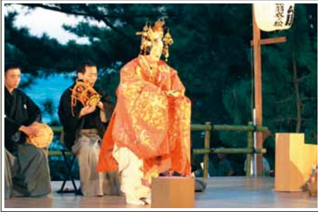
三保羽衣新能 能:羽衣

また、毎年秋に羽衣伝説発祥の地である三保松原で開催される「羽衣まつり」では、日本の伝統文化である、能「羽衣」や狂言などを上演する「三保羽衣新能」が開催されます。駿河湾の大海原を背景に、潮騒の響き、松林を揺らす秋風の中で上演され、幽玄な独特の世界を作り出します。