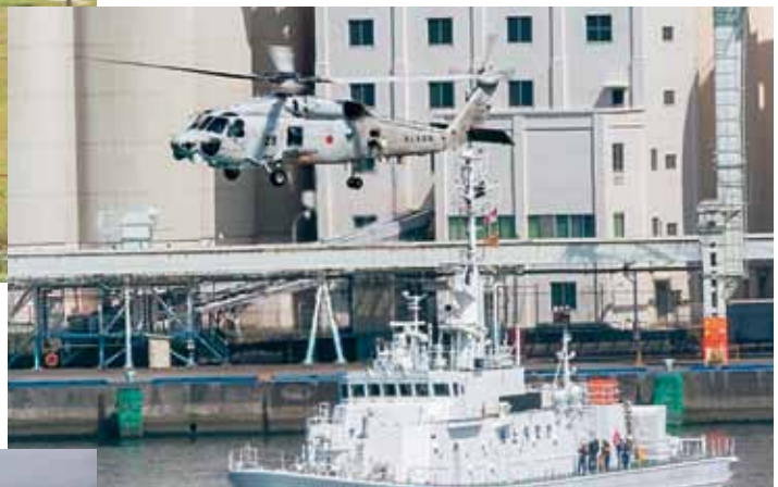
津波遭難者救助訓練