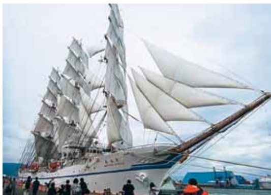
帆を広げた「日本丸」

※ 登しょう礼…船の実習生がマストに登り、「ごきげんよう!」と別れのあいさつをする伝統の儀式