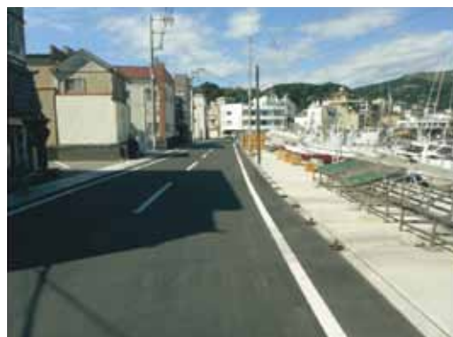
整備が完成した漁港道路