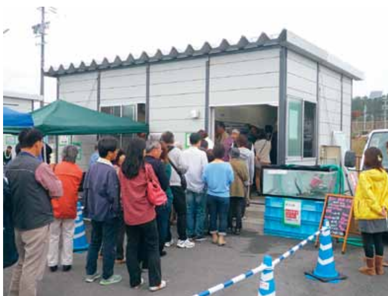
アンテナショップ

この二つの施設をきっかけとして福田漁港周辺が「食の拠点」となり、「人に伝えたい味」と「にぎわい」が創られることが期待されています。