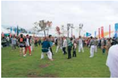
纏太鼓の練り歩き

祭りのクライマックスは花火大会。1発1発が夏の夜空に鮮やかに大輪咲きし、会場は来場者の歓声に沸きました。