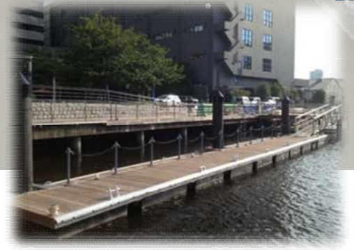
浮桟橋のイメージ 例:天王洲運河