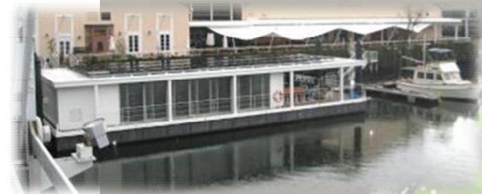
水上レストランのイメージ 例:天王洲・寺田倉庫