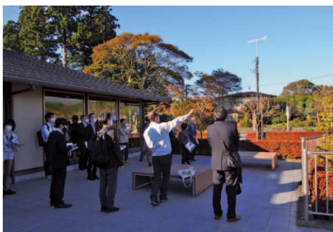
富士山・白糸ノ滝テラス