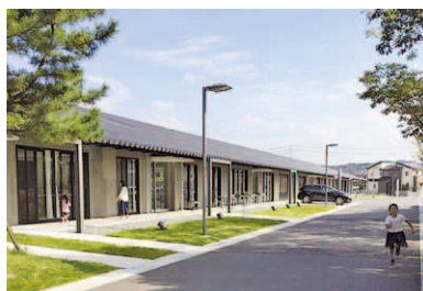
第9回 2016年 磐田市 豊岡中央交流センター