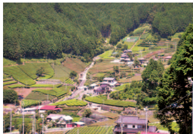
第1回 2008年 静岡市葵区 わさびとお茶の里 「有東木」