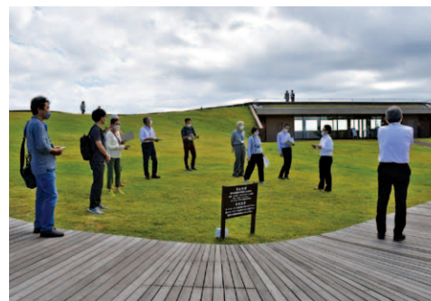
小室山リッジウォーク“MISORA”