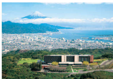
第6回 2013年 静岡市清水区 世界遺産富士山を望む風景美術館 「日本平ホテル」