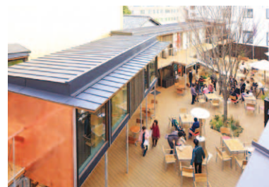
第7回 2014年 三島市 大社の杜 みしま