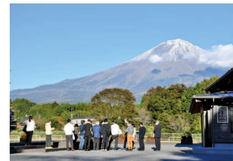
富士山・白糸ノ滝テラス