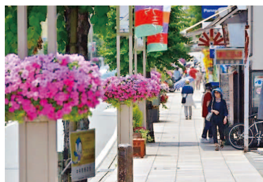
第10回 2017年 三島市 ガーデンシティみしまのシンボルロード 「花飾り」と「袖看板」