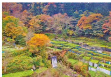
第11回 2018年 伊豆市 地域で継承！八岳地区の 「わさびの郷」づくり