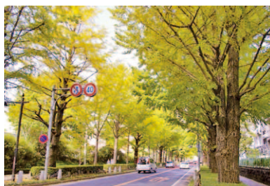
第4回 2011年 三島市 三島市景観重要樹木 「文教町イチョウ並木」