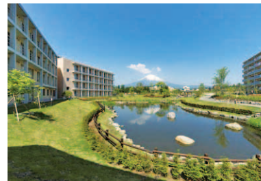
第2回 2009年 御殿場市 森の中の環境共生型まちづくり 「矢崎総業Y-TOWN御殿場」