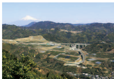
第5回 2012年 静岡市清水区 新東名とみかんの里 「原・新丹谷 (はら・あらたにや)」