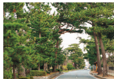
第12回 2019年 袋井市 旧東海道 久努の松並木