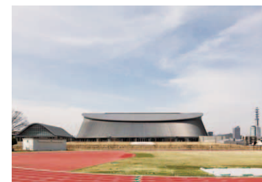
第8回 2015年 静岡市駿河区 静岡県草薙総合運動体育館 「このはなアリーナ」