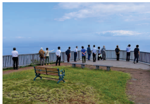
小室山リッジウォーク“MISORA”