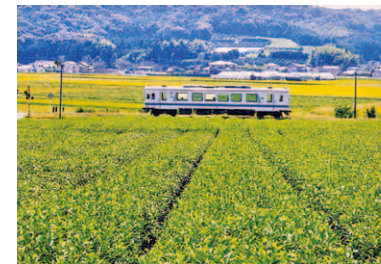
第3回 2010年 掛川市～湖西市 天浜線のある風景 (文化資源を際立たせる自然・産業景観)