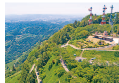
第13回 2020年 掛川市 伝統農法が織りなす茶草場テラス から望む東山大茶園