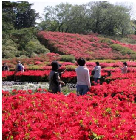
② 四季折々の変化を楽しみながら散策できる公園