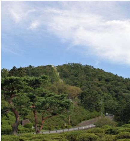
① 見上げて美しい緑豊かな小室山