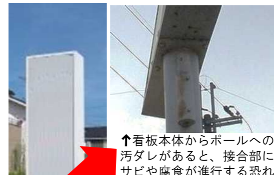
↑看板本体からポールへの汚ダレがあると、接合部にサビや腐食が進行する恐れ。