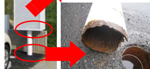
↑柱根元のサビを放置し、倒壊。