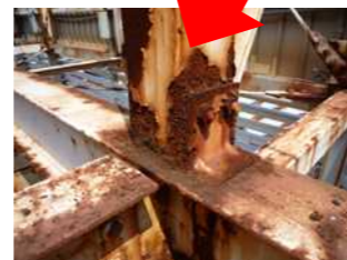
↑内部鉄骨のサビ・腐食。