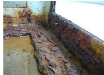
↑看板面(アクリル板)のひび、割れ、ゆがみ板面の落下により、内部に水が入り腐食する原因に。