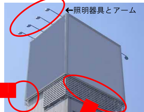
←照明器具とアーム

外照式の屋上看板では照明器具のアーム接合部の腐食やボルトのゆるみがあると器具が落下する恐れがあります。