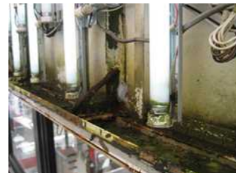
↑内照式看板内部の腐食、部材の腐食器具の劣化による出火の恐れも。