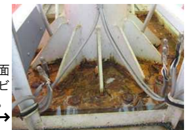
看板の根元がカバーで覆われている場合、表面はきれいでも内部でサビが進行している恐れも。