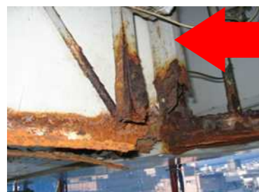
↑板面裏側のサビ、腐食。サビによる腐食はミルフィーユ状に剥がれ崩落する恐れも。