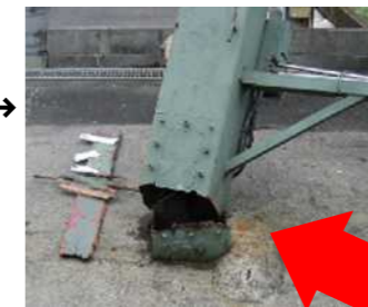
折れた柱の根元。点検口のボルト穴からサビが入り腐食して、鉄骨が破断した。

交通の激しい沿道で看板の柱が折れたが、隣地の看板が支えとなり、道路への倒壊を免れた事故。電線を切断すると停電による損害賠償額は膨大な金額になることも。