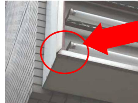
←パネルの変形、ズレ、破損の他、パネルの押さえ枠が変形し落下する場合も。

表示パネルの四方を押さえ枠で固定する欄間看板。複数枚のパネルを使用する場合は、隣り合うパネル同士をきちんと固定しないと、振動や風などで落下する恐れがあります。