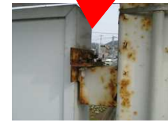
←取付金具のサビや腐食。ボルトやビス等が欠落していたら緊急の対応が必要。放置すると看板が落下する恐れも。