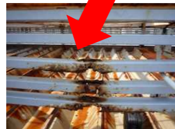
↑目隠しルーバーのサビ・腐食。