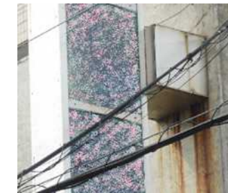
←ブラケット下に汚ダレが見られると、内部の取付金具にサビや腐食の可能性もある。