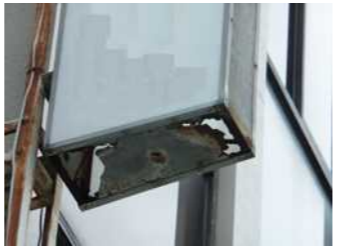
↑看板底部の留め具が壊れるとアクリル板が抜け落ちる原因にも。