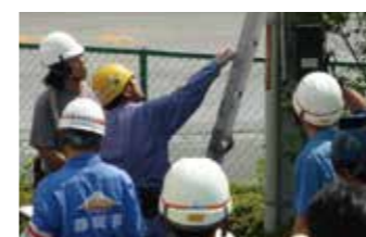
①災害1週間後を想定した電気設備復旧と用水訓練