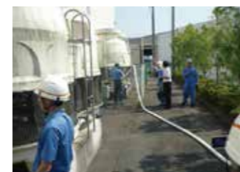
③可搬ポンプを使用して冷却塔内に水を補給