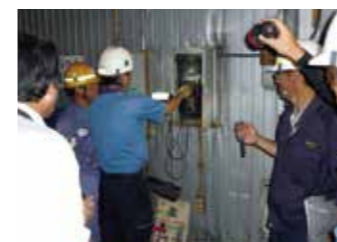
②異常がないことを確認し電源を供給