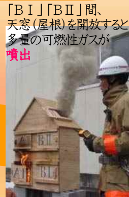
「B I」「B II」間、 天窗(屋根)を開放すると 多量の可燃性ガスが 噴出