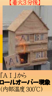
「A I」から ロールオーバー現象 (内部温度 300°C)