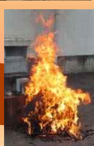
【着火 24 分後】