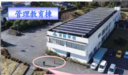
校長、副校長が飛行を見守る