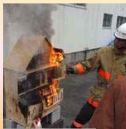
【着火 21 分後】