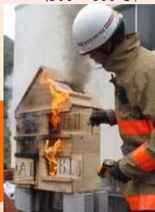
【着火 17 分後】