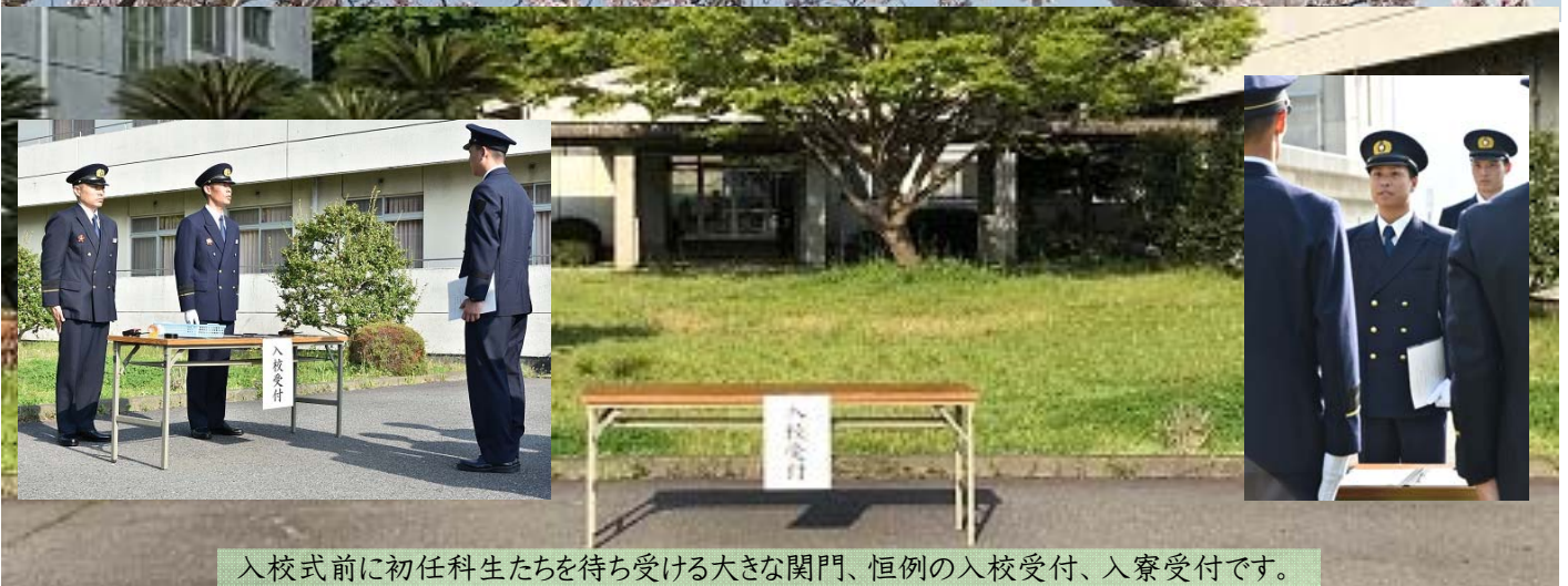
入校式前に初任科生たちを待ち受ける大きな関門、恒例の入校受付、入寮受付です。