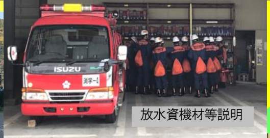
放水資機材等説明