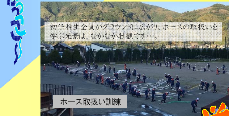
初任科生全員がグラウンドに広がり、ホースの取扱いを学ぶ光景は、なかなか壮観です…。