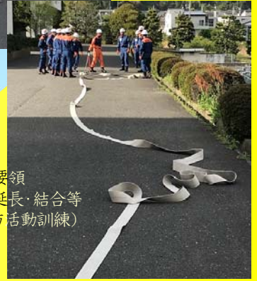
1・2 番員要領 ～ホース延長・結合等 (消防活動訓練)