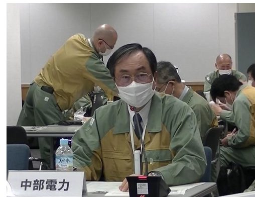
オフサイトセンター運営訓練の様子