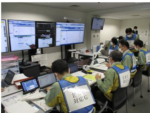
原子力規制庁連携訓練の様子