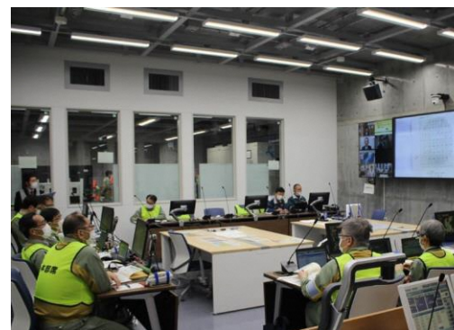
発電所本部運営訓練の様子