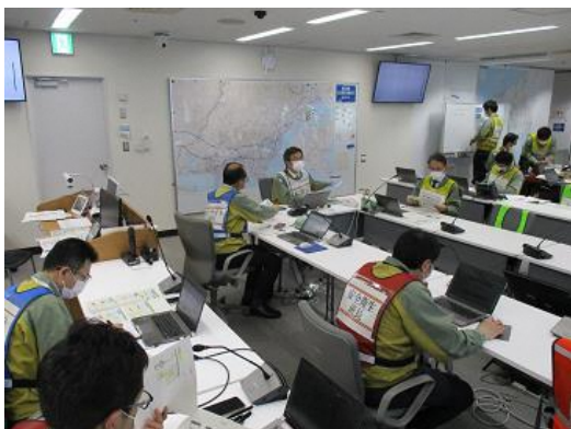
本店本部運営訓練の様子