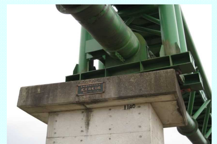
水管橋支承破損によるズレ

『「患水不盡」東日本大震災からの復旧・復興に向けた宮城県企業局の対応と取組』平成27年3月 宮城県企業局より