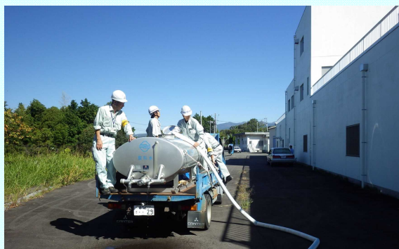
三島市水道課と連携した応急給水訓練