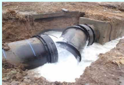
伸縮可とう管の拔出し(鋼管2,400mm)