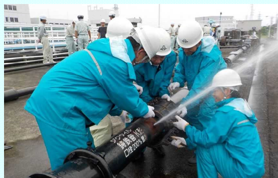
水道技術研修施設での漏水補修訓練