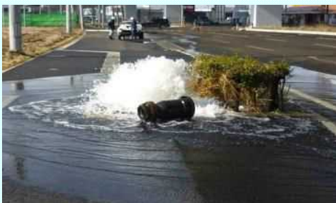
空気弁の破損による漏水