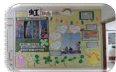
壁面掲示板の活用